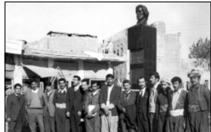
مه‌م و نووسه‌رانی هه‌ولێر له ژێر په‌یکه‌ری حاجی قادری کۆبی