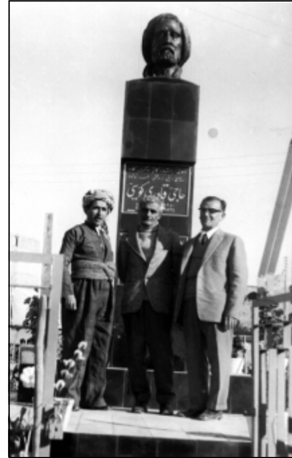
نه‌ریمان و هێمن و مه‌م له ژێر په‌یکه‌ری حاجی قادر له کۆیه

به‌لام نه‌گهر ئه‌و شاعیره یان ئه‌و نووسهره مرد «وه‌ک ده‌لین مانگا مرد و دو برا» تازه داوای هیچ له کس نا‌کا و ئه‌وی له ژيانا کردویه به‌بێ نرخ بژاردن بۆ هه‌موو کس ماوه‌ته‌وه. ئه‌وسا هه‌موو کس به‌بێ ترس له زیان ده‌توانی ب‌لێ: زۆرم خۆشده‌ویست و خۆشم ده‌وی و چاکی گوتوه و زۆر به‌ر دل‌م ده‌که‌وی و نووسهریکه هه‌رگیز نامری و