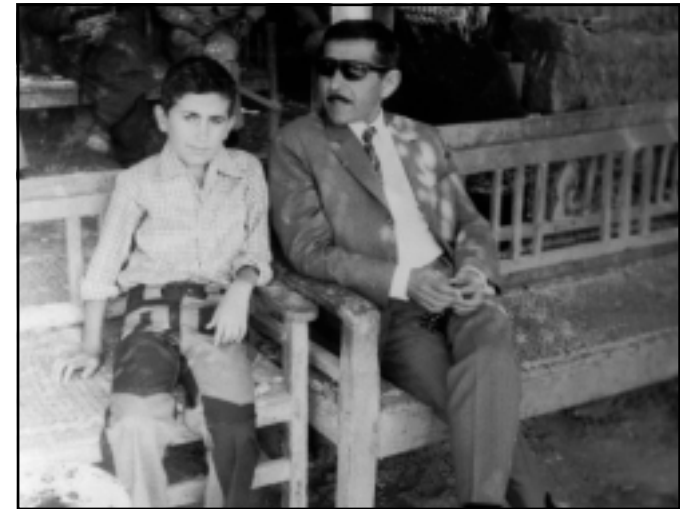
مه‌م و زاگرۆسی کوری هه‌ژار

نامه‌که‌تم پێ گه‌یشته زۆر به‌خه‌به‌ری نه‌خۆشیت دل‌ته‌نگ بووم و غه‌یری ئاوات و دو‌عای به‌خێر نازانم چیم له‌ ده‌ست دیت.