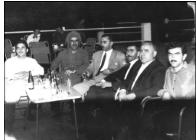
له‌ وێنه‌که‌دا مه‌م و هه‌ژار «هه‌ژار به‌جلی کوردی ده‌ناسرێته‌وه»