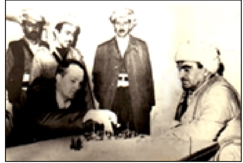
مصطفى بارزاني وهو يلاعب الصحافي الألماني ديشتر وخلفه إدريس بارزاني واسعد خوشوي