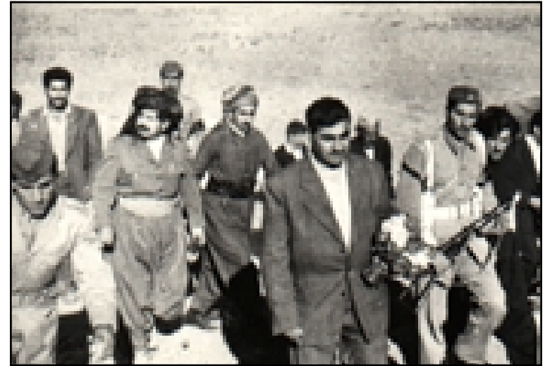
مصطفى بارزاني وخلفه الشيخ عبداللطيف شيخ محمود الحفيد في زيارة الى مقبرة سيوان في السليمانية ١٩٥٨