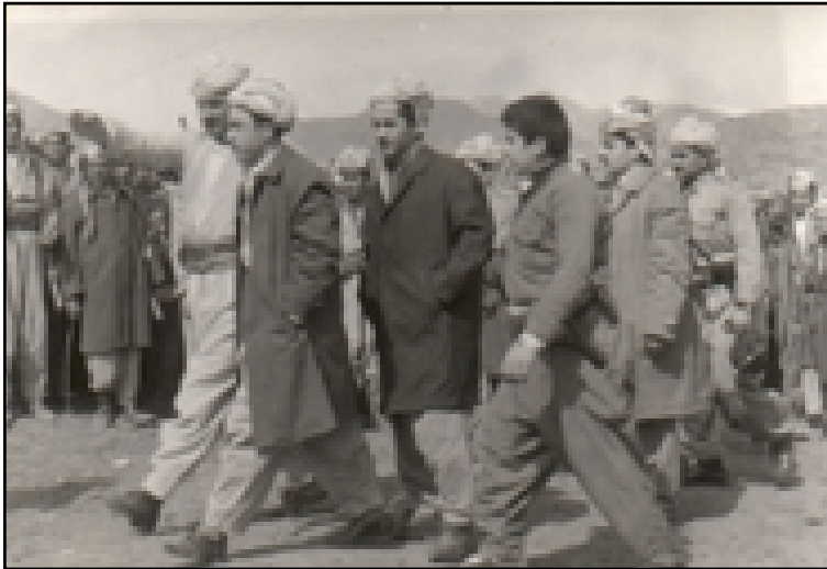
إدريس بارزاني في الوسط ومسعود بارزاني، فرانسو حريري وصابر بارزاني