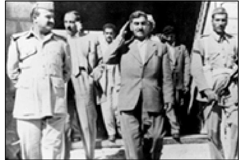
مصطفى بارزاني بعد عودته من الإتحاد السوفيتي السليمانية ١٩٥٨