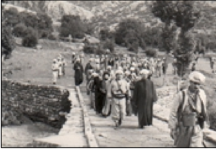
مصطفى بارزاني مع عدد من علماء الدين على جسر ناپردان بعد اتفاقية آذار