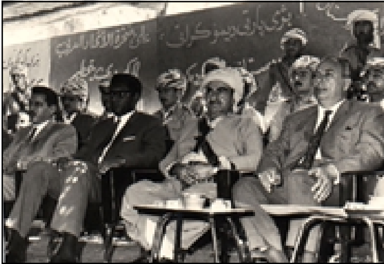
مصطفى بارزاني في إحدى جلسات المؤتمر الثامن للحزب الديمقراطي الكردستاني - ناپردان ١٩٧٠