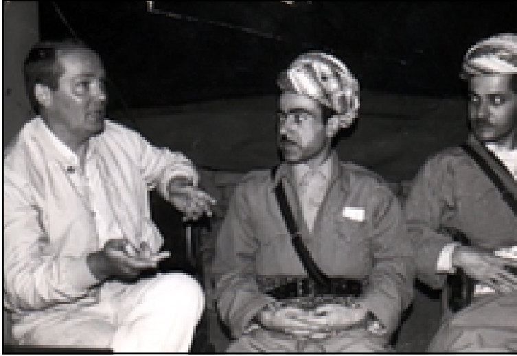
إدریس بارزانی مع الصحافي الألماني ديشنر وفي يمينه مسعود بارزاني - ١٩٧٤