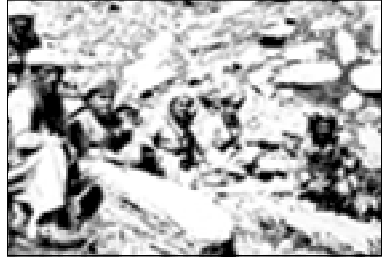
مصطفى بارزاني مع عدد من الپيشمرگه في جبهات القتال في ثورة ايلول - كويسنجق ١٩٦٣