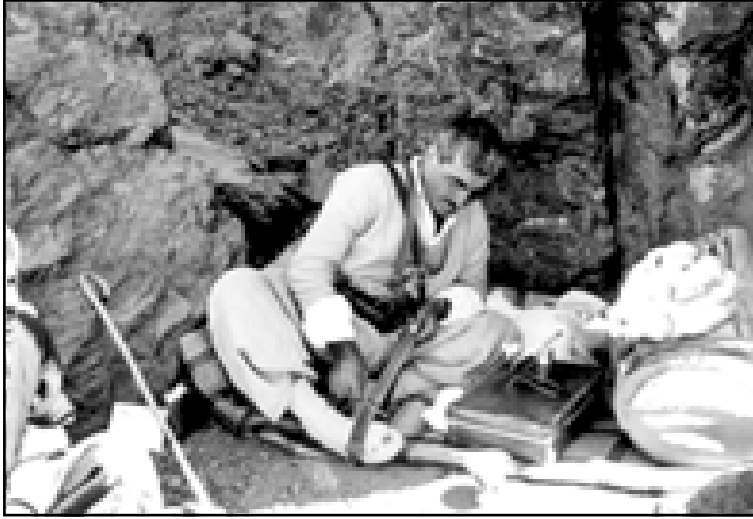
مصطفى بارزاني أثناء ثورة ايلول