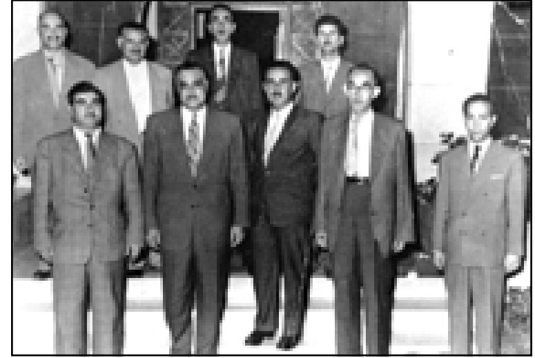
من اليسار الصف الأمامي: مصطفى بارزاني، جمال عبدالناصر، نوري أحمد طه، صالح بگ ميران، ... والصف الخلفي: ميرحاج احمد، ابراهيم احمد، صادق شيخ بابو واسعد خوشوي القاهرة ١٩٥٨