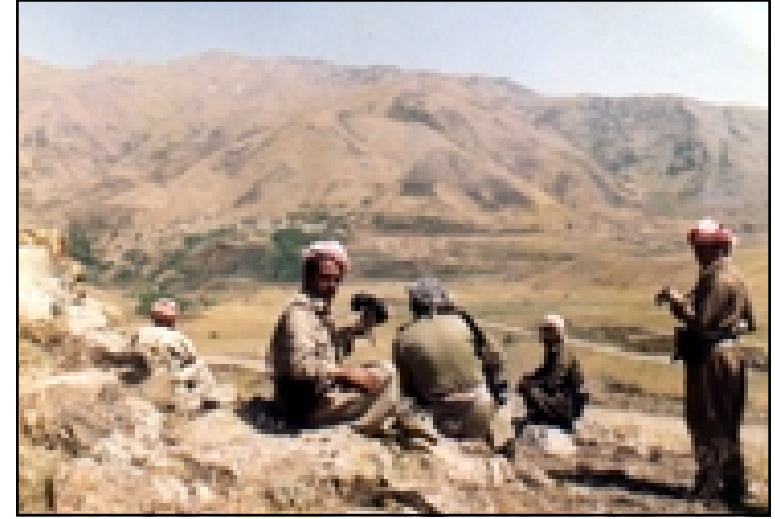
أدریس بارزانی مع عدد من پیشمرگه في جبال کردستان