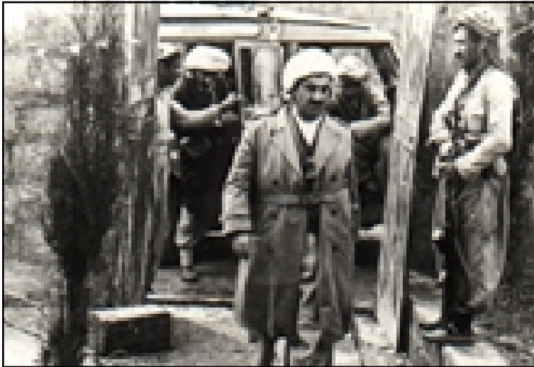
مصطفى بارزاني - رانيه ١٩٦٤