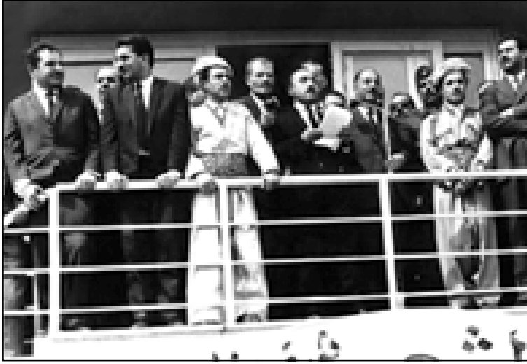
من اليسار: دارا توفيق، محمد محمود عبدالرحمن، أدريس بارزاني، عزة الدوري، محمود عثمان، الرئيس العراقي أحمد حسن البكر، مسعود بارزاني، وصادق حسين، عند اعلان اتفاق الثورة الكردية مع الحكومة العراقية. بغداد - آذار ١٩٧٠