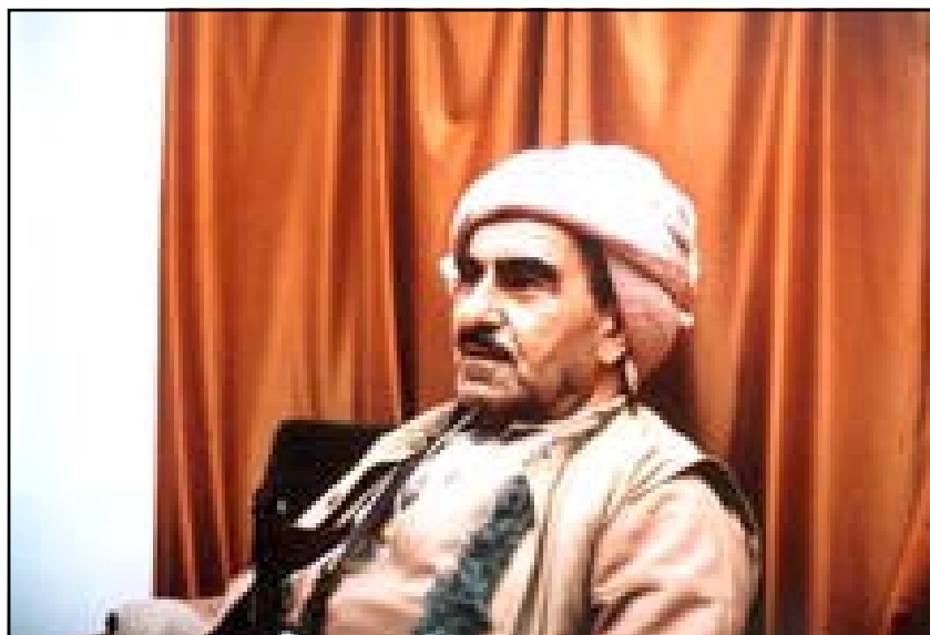
بارزانی له دواى سالى ۱۹۷۰