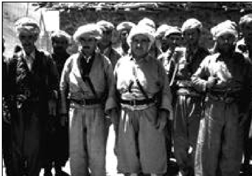
بارزانی دوای سالی ۱۹۷۰