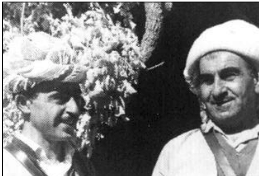
بارزانی و کاک ئیدریس