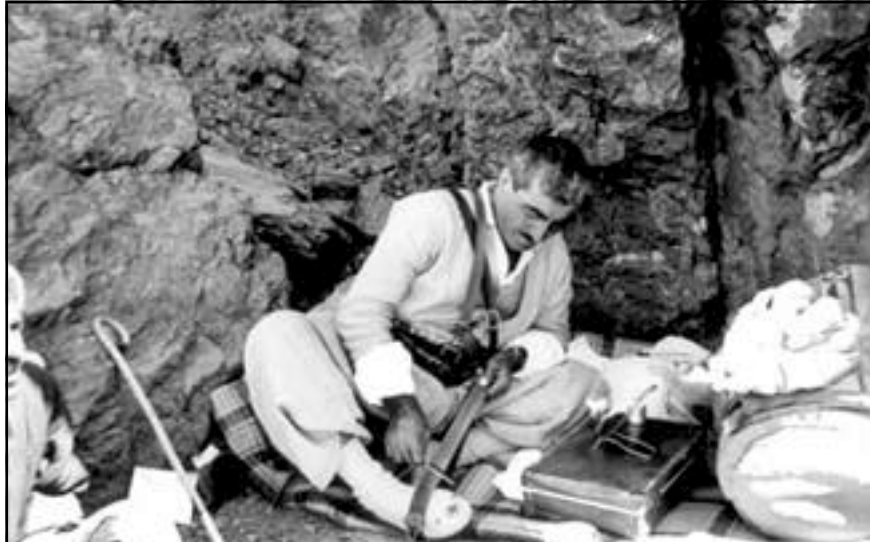
بارزانی له شوپشی تهیلولدا