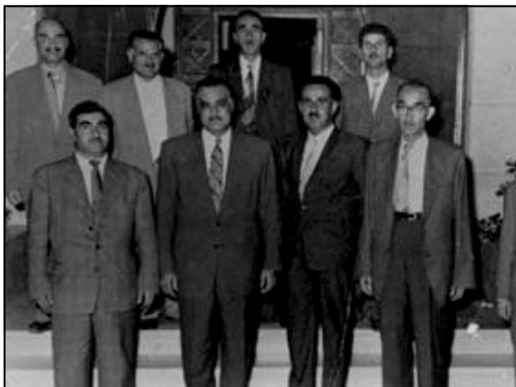
بارزانی و جمال عبدالناصر قاهره ۱۹۵۸