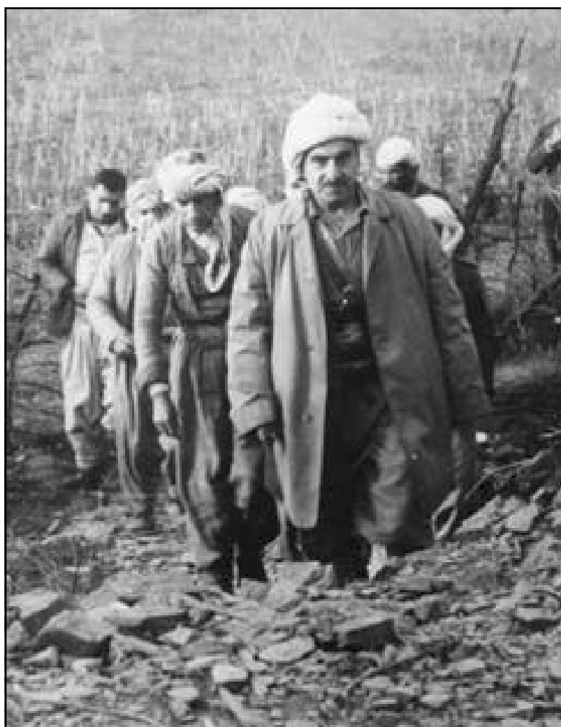
بارزانی سالی ۱۹۷۰ ناوپردان