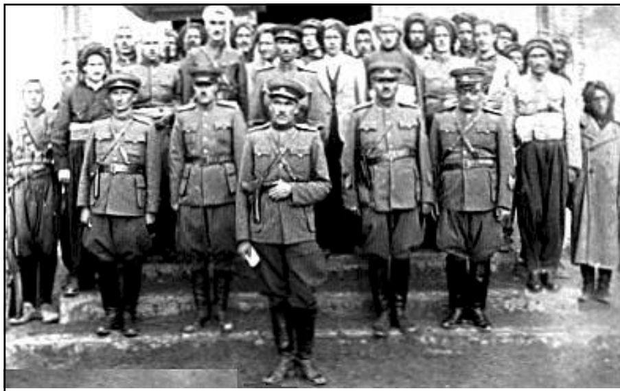
ئه فسه رانی سوپای کوردستان