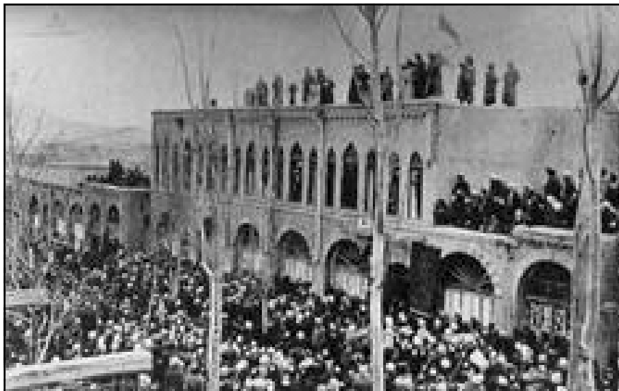
۲۰ سه‌رماه‌ز ۱۳۲۴ «۱۷ کانون ۱۹۴۵»، مه‌هاباد. نالای ئیرانیان له‌سه‌ر باله‌خانه‌ی دادگه‌ دابه‌زاند و نالای کوردستانیان به‌رزکرده‌وه