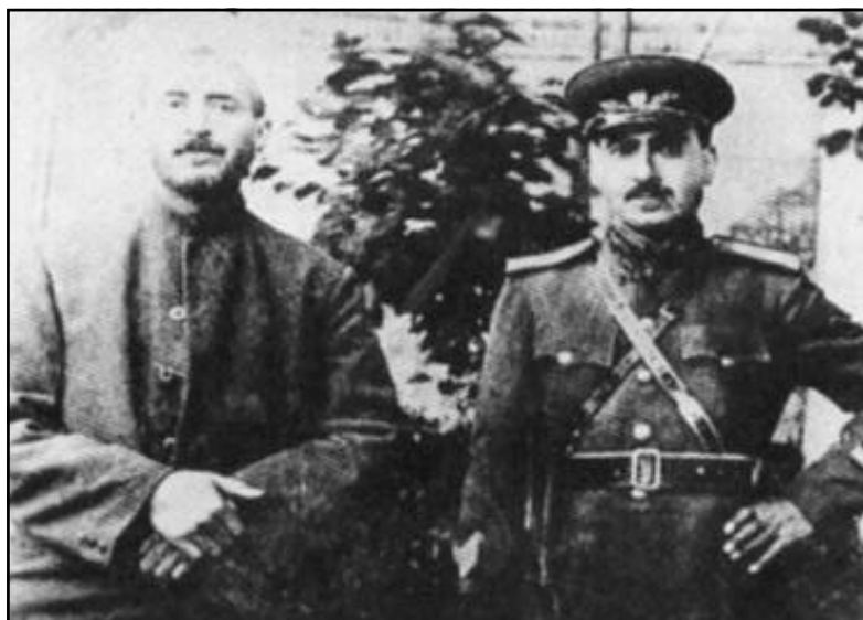
پیشهوا قازی محمد و جنه‌رال بارزانی مه‌هاباد ۱۹۴۶