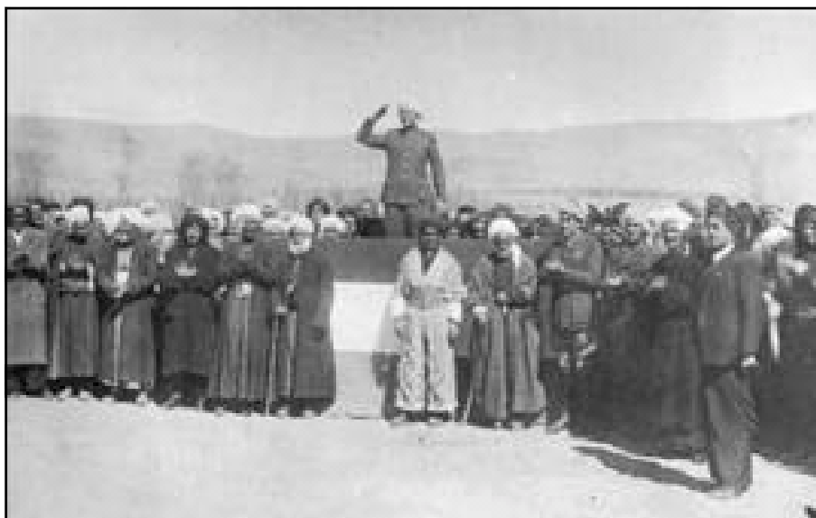
قازی محمەد لە پۆژی راگەیانندی کۆماردا. بارزانی لە خوارهوه وهستاوه. ۲۲ کانوون ۲ سالی ۱۹۴۶ - ۲ رتبه‌ندان ۱۳۲۴