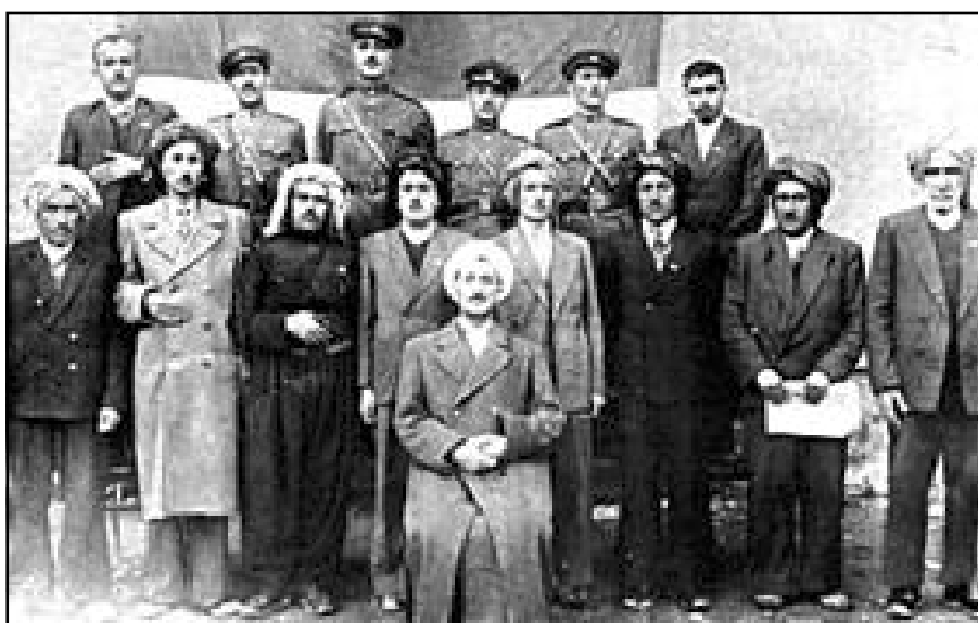
پیشه و قازی محهمه د و کابینه ی حکوومه تی کوردستان و هه ندیک کاربه دهستانی تر مه هاباد - شویاتی ۱۹۴۶