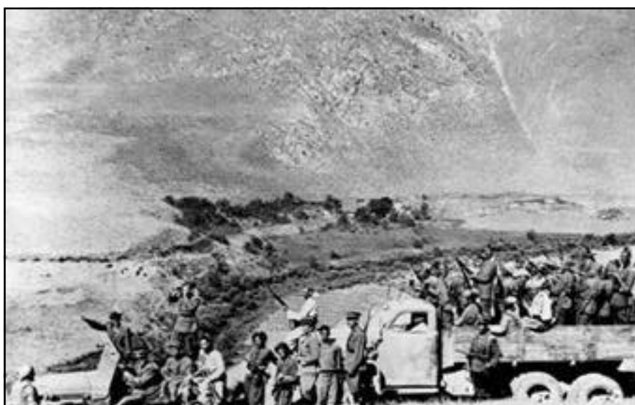
پیشمەرگەکانی بارزانی و پیشمەرگەکانی سویای کۆمار بەرەى سەقز «١٩٤٦»