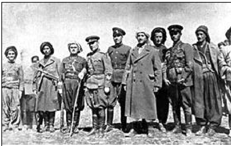
قازی محمەد لە کاتی سەرۆک کۆمارەتیدا