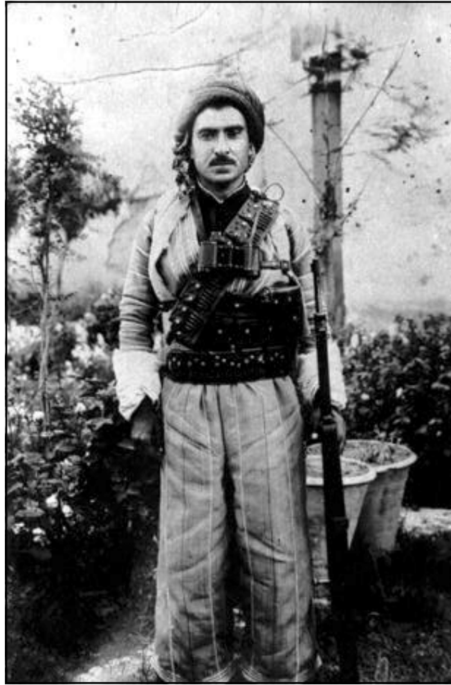
بارزانی نهمر سالی ۱۹۴۳