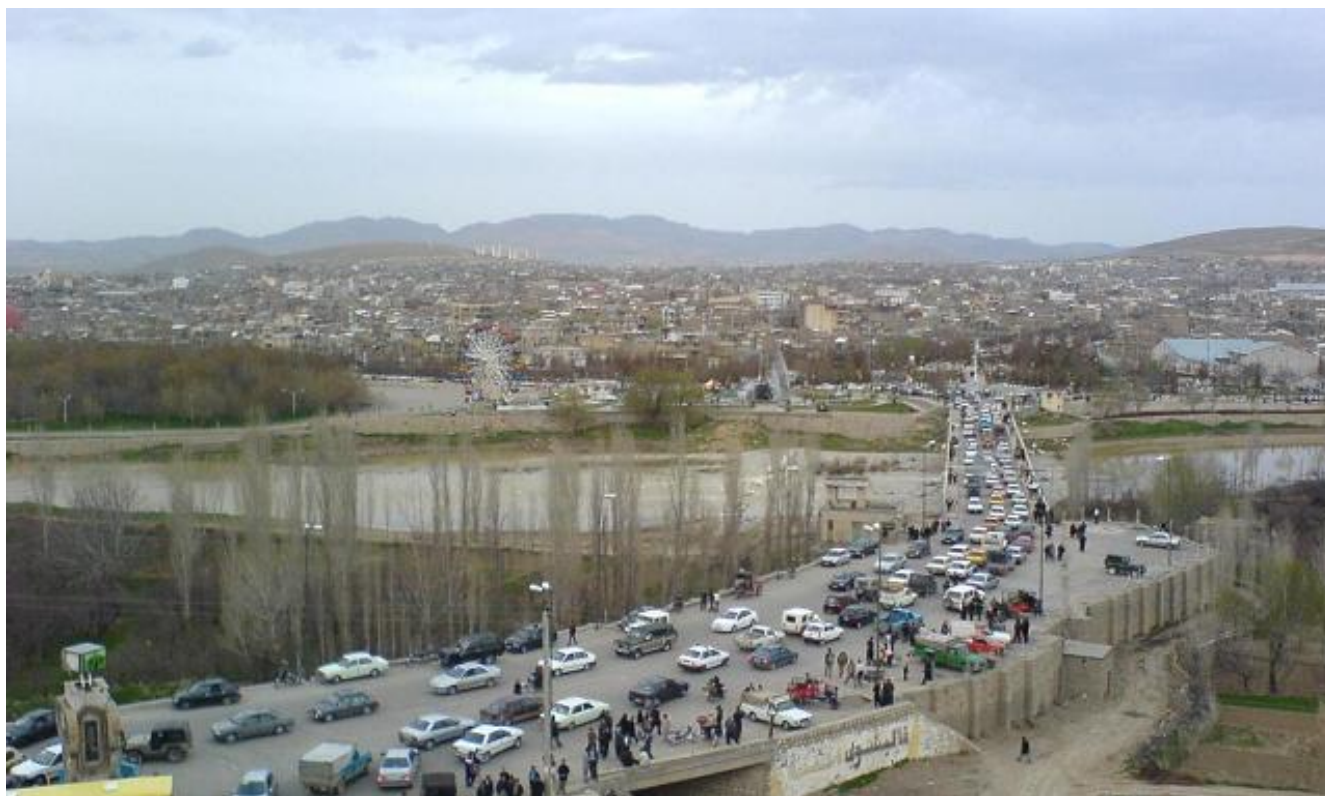
وینە ی شاری بۆکان