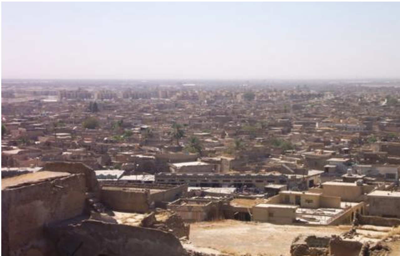
وینه‌ی شاری کهرکووک