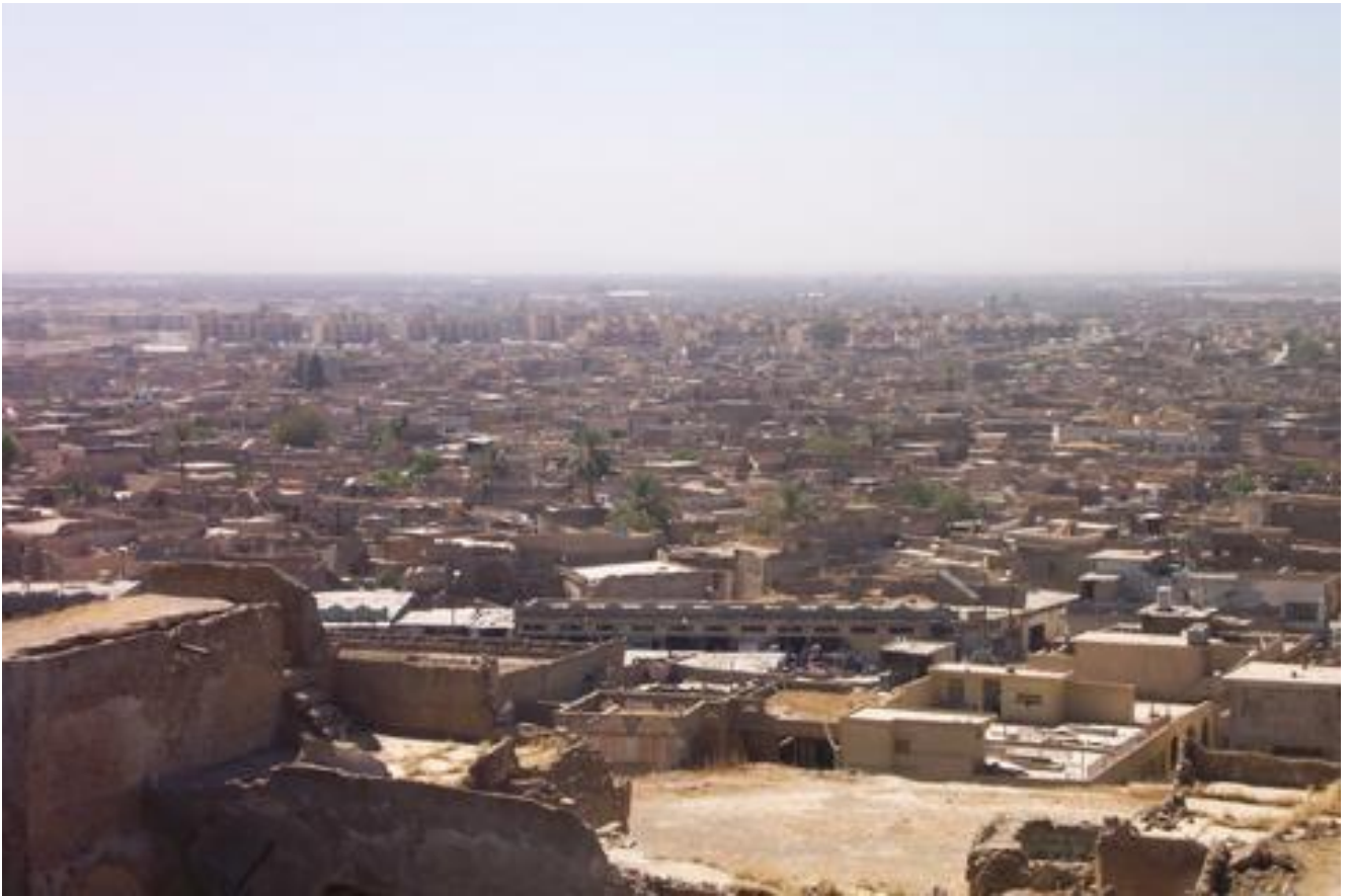
وینه‌ی شاری کهرکوک